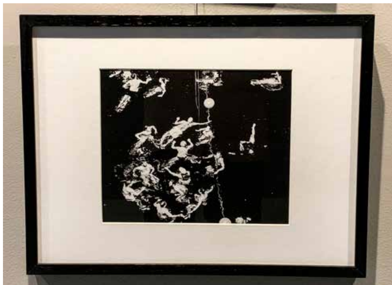
BALLET (MÉXICO) 42x32 cm R$ 900,00