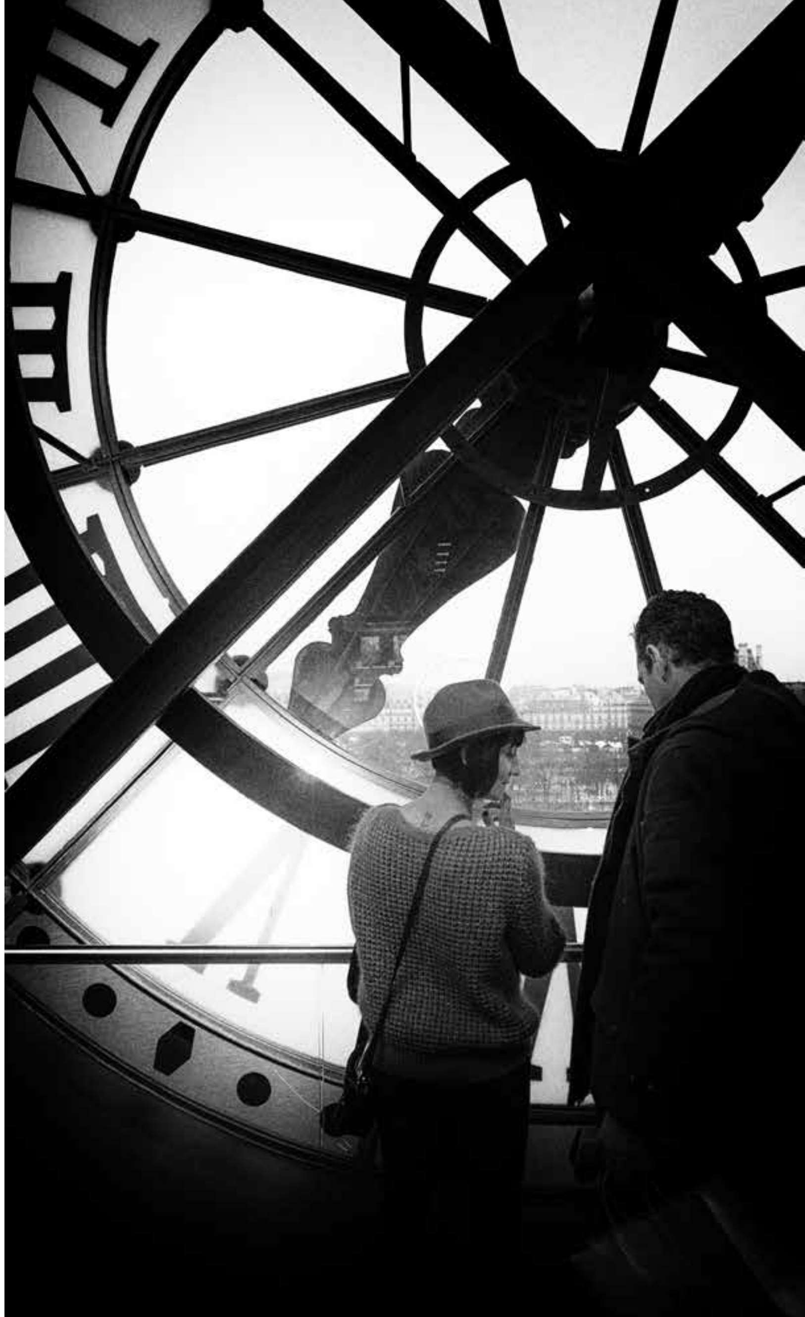
ORSAY (FRANÇA) 60x40 cm R$ 1.400,00