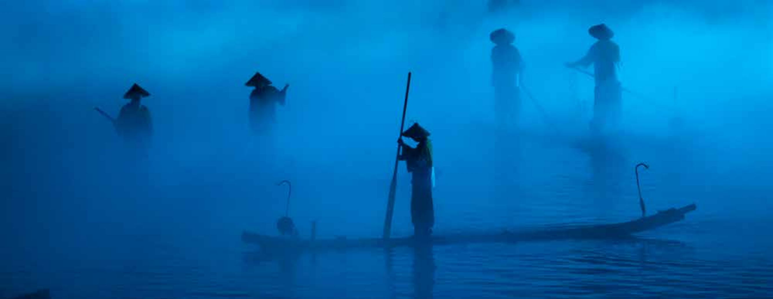
YANGSHUO (CHINA) 62x25 cm R$ 1.200,00